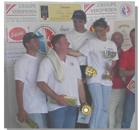
Remise des trophées aux vainqueurs lors des championnats de France d'ULM. Aérodrome de Montdidier - Somme